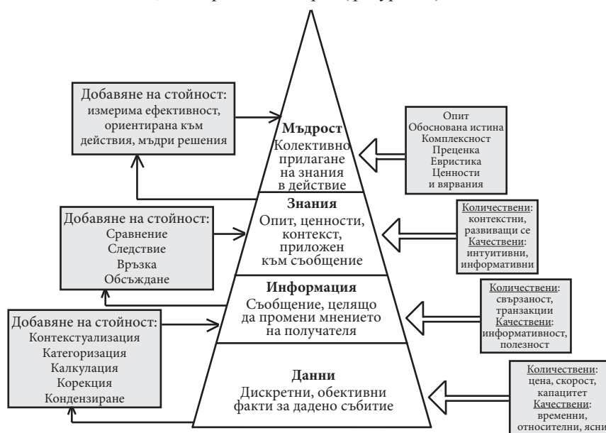
Фигура 2.1 Пирамида на знанието [3]

в резултат на средата и познанията на автора и спецификата на целите му [2]. Взаимоотношенията между данни, информация, знания и мъдрост формират пирамида. В основата ѝ са данните, следвани в йерархията от информацията, след това знанията, и мъдростта на върха (фигура 2.1).